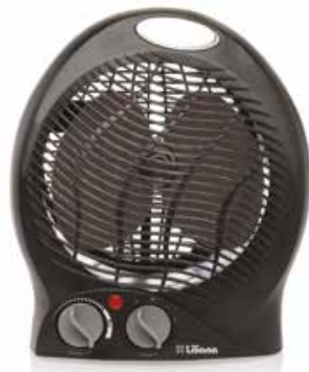
Alimentación: 220-240 V ~ 50-60 Hz Potencia: 1000/2000 W